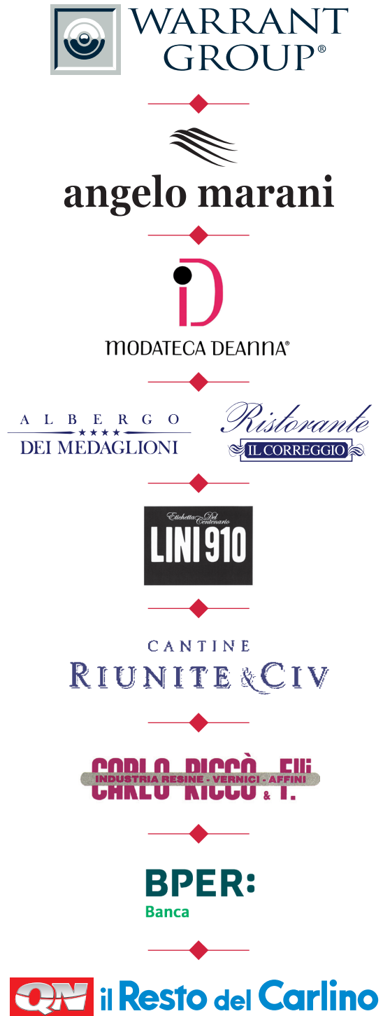
grafica e stampa Cromatografica