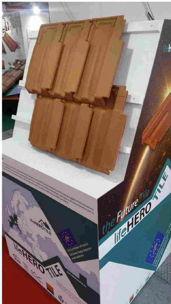
Le nuove tegole marsigliesi Terreal SanMarco

Ritaglio stampa ad uso esclusivo del destinatario, non riproducibile.