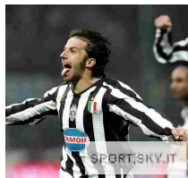
Inter-Juve, 7 grandi imprese bianconere a San Siro