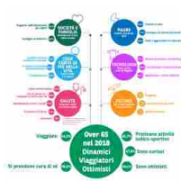
BNP Paribas Cardif: i nuovi Over 65, la prima generazione Senior digit...