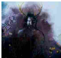
BLUE PARROT FISHES - Ascolta il Concept EP della band toscana (Beng! D...