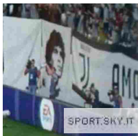
Maradona simbolo Juve, gaffe clamorosa in Fifa 18